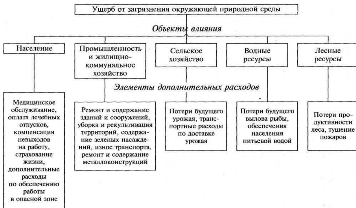
Рис. 1 Структура расходов, вызываемых загрязнением окружающей природной среды